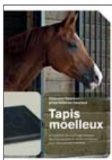
Tapis moelleux Système de couchage dans les écuries et les box à chevaux