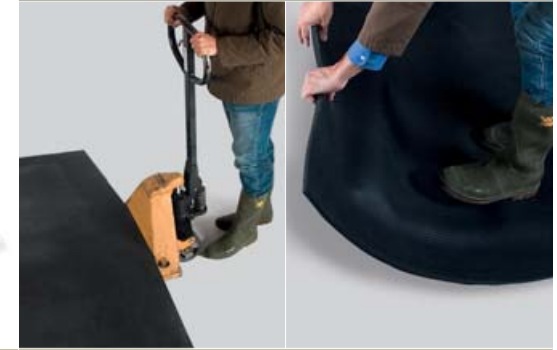
Déplacement rapide et facile.