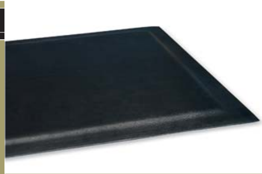
Le tapis moelleux – caoutchouc vulcanisé de grande qualité.