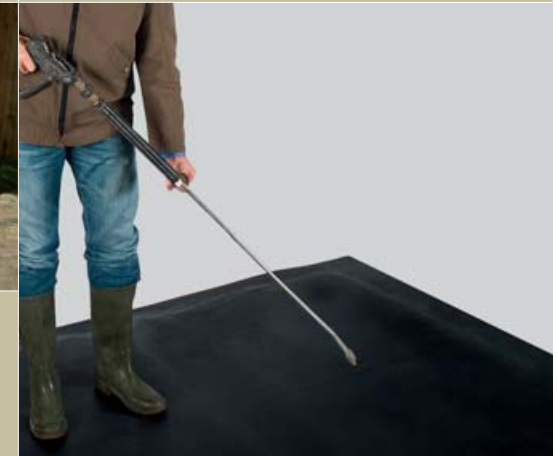
Nettoyage facile avec un nettoyeur à haute pression.

En alignant plusieurs tapis moelleux ensemble, on obtient une surface de couchage homogène, uniforme et souple; situation optimale pour les besoins de chevaux élevés en groupe.