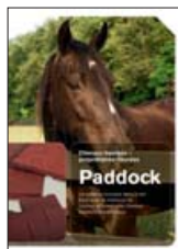
Paddock Système de sol pour l'extérieur et l'intérieur

Nous restons à votre entière disposition pour de plus amples informations.